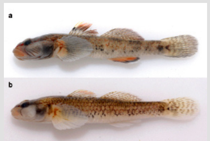
Rhinogobius sagittus a - самец, b - самка

"Two new freshwater gobies of the genus Rhinogobius ( Teleostei: Gobiidae ) in southern China, around the northern region of the South China Sea."