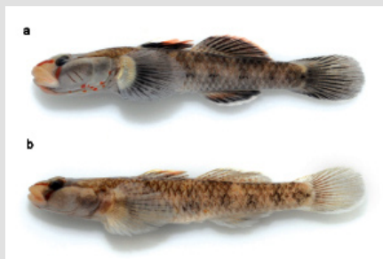
Rhinogobius rubrolineatus a - самец, b - самка